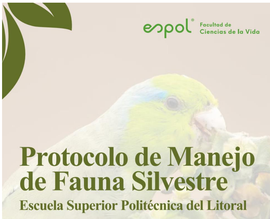
Figura 3. Captura de la portada del protocolo de manejo de fauna silvestre

Considerando que las actividades académicas y administrativas se desarrollan en un entorno de conectividad y amortiguamiento de BVP Prosperina, es común que haya encuentros con fauna, por esta razón se diseñó un protocolo en abril de 2025 que establece medidas de acción y reacción ante fauna en diferentes categorías.