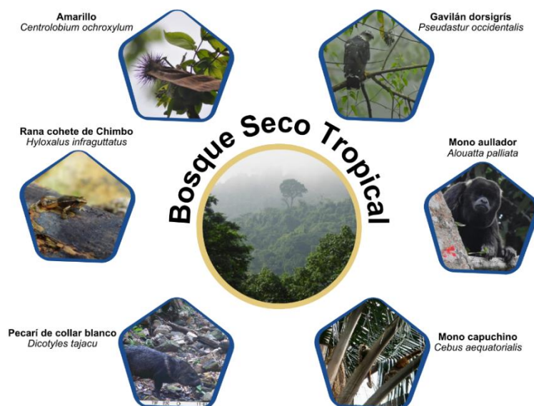
Figura 1. Objetos de Conservación BVP Prosperina estipulados en el Plan de Manejo Integral

El BVP Prosperina es mantiene un ecosistema de bosque deciduo (en las zonas bajas) y semideciduo (en las zonas altas), los cuales son amenazados por diferentes factores. Esto impulsó a la creación del PMI de BVP Prosperina entre octubre y diciembre de 2023 con su respectiva aprobación por el Ministerio del Ambiente y Energía en abril de 2024 y posterior actualización de su delimitación en abril de 2025. En el plan se definieron cinco objetos de conservación, que son especie que representan al bosque por alguna característica particular.