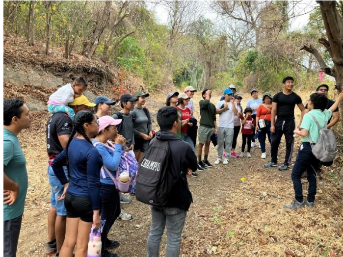
Figura 2. Visitantes en con interpretación de estudiantes en el BVP Prosperina